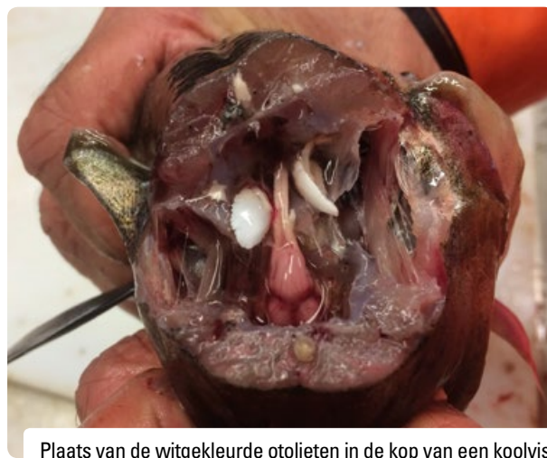
Plaats van de witgekleurde otolieten in de kop van een koolvis.

Wie wil weten wat voor elementen er precies in een otoliet zitten, heeft gespecialiseerde apparatuur nodig.