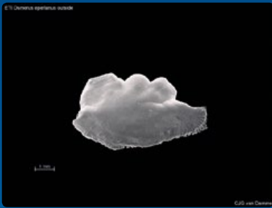
Otoliet (gehoorsteentje) van een spiering.