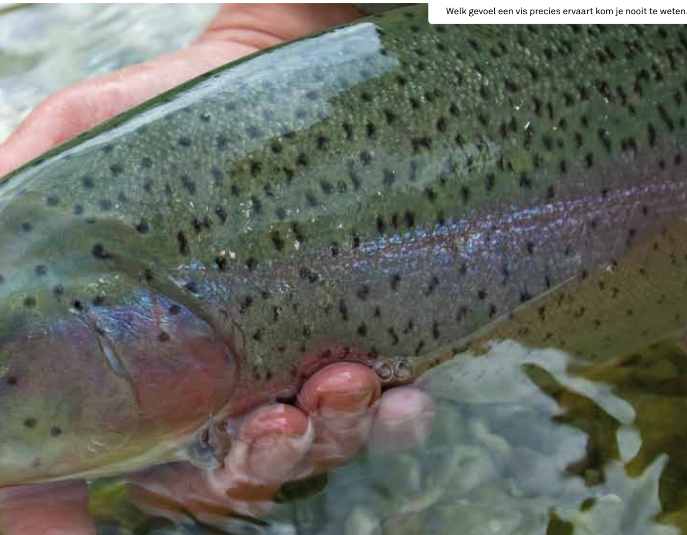
Welk gevoel een vis precies ervaart kom je nooit te weten.

Verspui stelt in de conclusie van het Visionair-artikel dat vissen niet bewust pijn kunnen lijden. Van den Bos vindt dat te algemeen geformuleerd. "Als je met geen pijn lijden bedoelt: een vis heeft geen langdurig negatieve ervaring van een gebeurtenis, dan zal je dat via experimenten helder moeten maken. Ik kan me voorstellen dat daar bij sommige vissoorten sprake kan zijn van een langdurig negatieve ervaring, die een vis zich gewaar wordt. De cruciale vraag is: kun je dat aan z'n gedrag zien?" Want gedrag kun je zien als de uitleeswaarde van de interne toestand van een dier. ➤