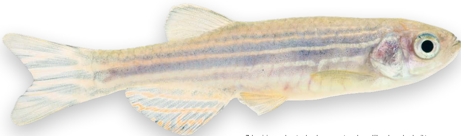
Zebrafisjes worden steeds vaker voor wetenschappelijk onderzoek gebruikt.